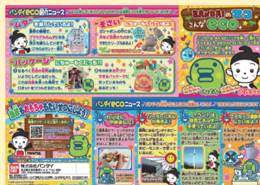
2008年のお子様向け環境リーフレット (2008/11 中旬より配布)